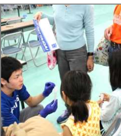
● 遺伝子採取 (任意)