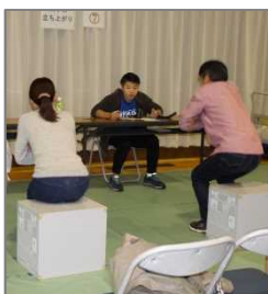
● 30秒椅子立ち上がり